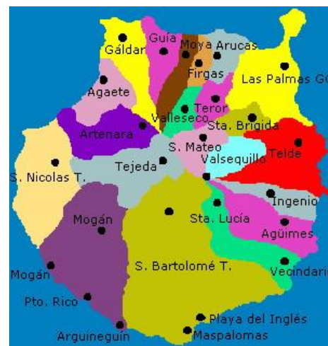
Isla de Gran Canaria

La afectada de Fibromialgia y/o SSC inscrita tiene su domicilio habitual en los siguientes códigos postales y poblaciones: